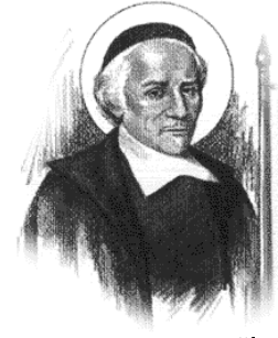
นักบุญยอห์น เอ็ดดส์